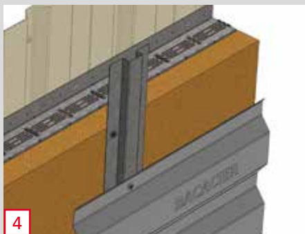
4 Fixation de l'ossature intermédiaire en cas de bardage horizontal