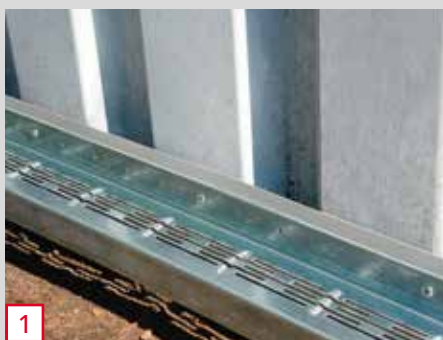
1 Diagnostic et préparation du support (avec fermeture des entrées/sorties d'air du bardage existant)