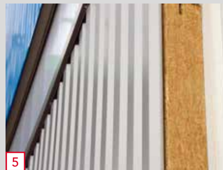
5 Fixation de la nouvelle peau extérieure