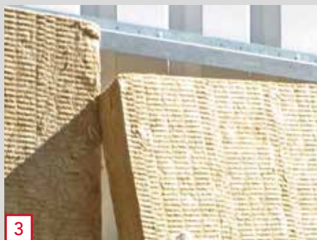
3 Pose de l'isolant ROCKBARDAGE RENO