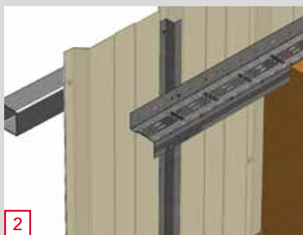
2 Fixation des Z THERMIQUES® sur ossatures de renfort fixées dans la structure